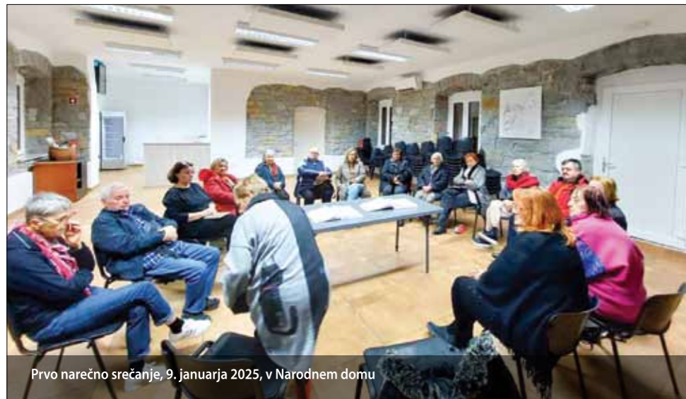
Prvo narečno srečanje, 9. januarja 2025, v Narodnem domu

Na prvem srečanju, 9. januarja, se nas je v Narodnem domu zbralo 19 različnih generacij, seveda ne najmlajših, in bilo nas je dovolj, da smo najprej ugotavljali, kako se žal narečje izgublja, nato smo se vprašali, če sta pobežansko in čežaransko narečje enaka in v nadaljevanju, kako bi se lotili zbiranja besedišča.