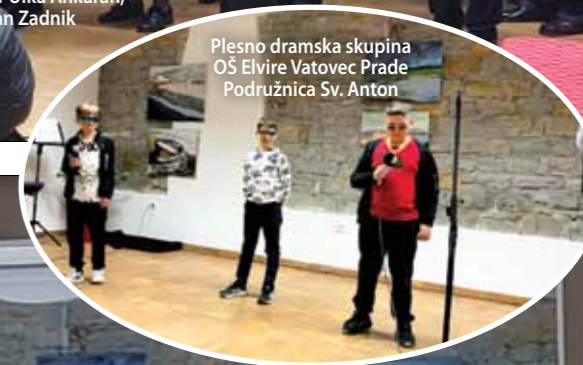
Plesno dramska skupina OŠ Elvire Vatovec Prade Podružnica Sv. Anton