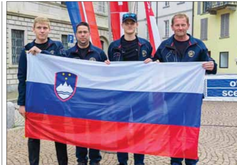
Military Cross v Bellinzoni, Švica

V letošnjem letu smo se po dolgem, petletnem premoru ponovno udeležili tekmovanja Military Cross v Bellinzoni, v švicarskem kantonu Ticino, ki ga organizira tamkajšnja zveza častnikov. Lahko se pohvalimo, da smo bili edini predstavniki iz Slovenije in da so nas gostitelji tako kot vedno zelo lepo sprejeli, nam čestitali za zbrani pogum in nas presenetili z manjšim darilom. Obljubili smo jim, da jih naslednje leto spet obiščemo.