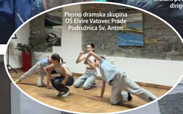
Plesno dramska skupina OŠ Elvire Vatovec Prade Podružnica Sv. Anton