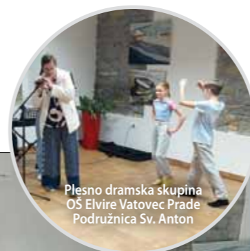
Plesno dramska skupina OŠ Elvire Vatovec Prade Podružnica Sv. Anton