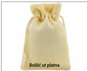
Bolžić ut platna