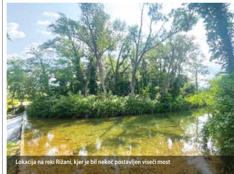
Lokacija na reki Rižani, kjer je bil nekoč postavljen viseči most