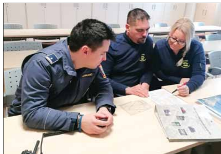
Delavnica štabnega vodenja OGZ na Gasilski brigadi Koper

Seveda ne smemo pozabiti niti na naš čudovit gasilski dom in njegovo okolico, katero skrbno urejamo in zanjo skrbimo. Tako so naši pridni fantje v zgodnji pomladi obrezali oljke ter sproti kosili travo. Prav tako smo naredili generalno čiščenje prostorov. Sproti pa se tudi vzdržuje oprema in naša vozila, da so vedno pripravljena in brezhibna za intervencije.