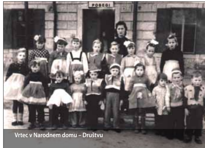
Vrtec v Narodnem domu - Društvo