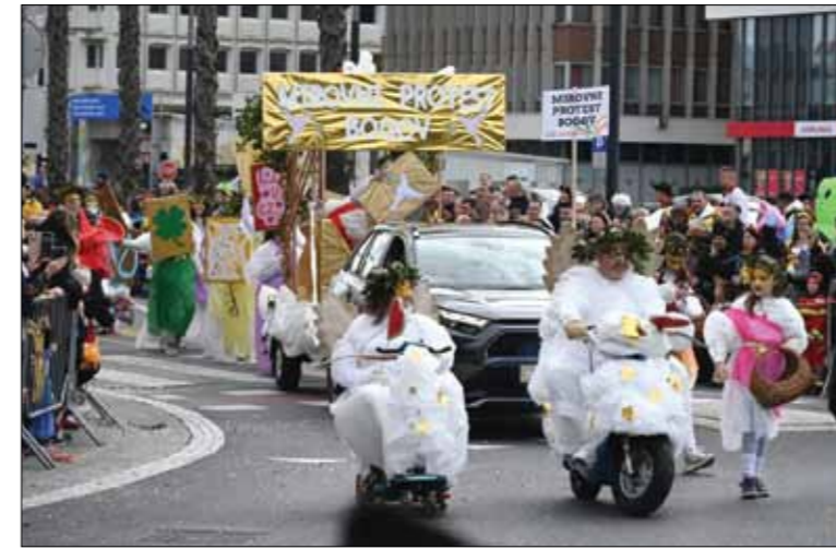
Pustna skupina KD Pobegi-Čezarji: »Mirovni protest bogov« na 15. Istrski pustni povorki v Kopru