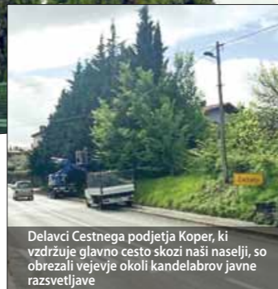
Delavci Cestnega podjetja Koper, ki vzdržuje glavno cesto skozi naši naselji, so obrezali vejevje okoli kandelabrov javne razsvetljave