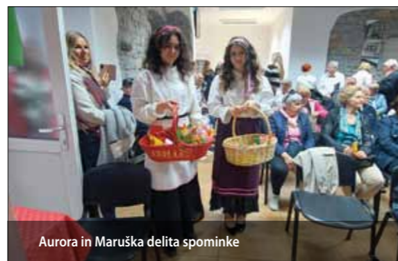
Aurora in Maruška delita spominke