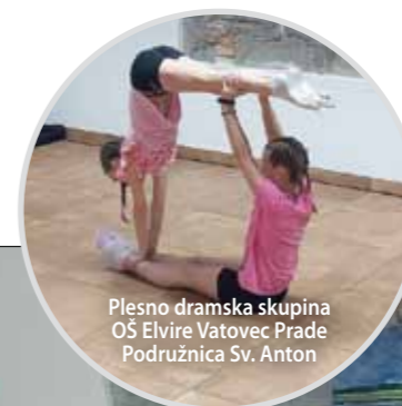
Plesno dramska skupina OŠ Elvire Vatovec Prade Podružnica Sv. Anton