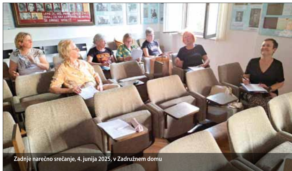
Zadnje narečno srečanje, 4. junija 2025, v Zadružnem domu

Dogovorili smo se, da bomo besede zbirali po sklopih na določeno temo, povzete po istrobeneškem jezikovnem atlasu Suzane Todorović, prilagojene vaškemu okolju, kjer marsičesa, kar so imela mesta, ni bilo. Srečevali smo se na dva tedna, v povprečju po 9 udeležencev, da smo prediskutirali vse zbrane besede posameznega sklopa v ednini in množini ter posebnosti, se poenotili glede ustreznosti besed in označili razlike med čežaransčino in pobežanščino, kjer je bilo potrebno. Kulturno društvo Pobegi – Čežarji je poskrbelo, da so ob koncu vsakega srečanja prisotni udeleženci prejeli nov sklop besed v tiskani obliki, odsotni pa po elektronski pošti. Do naslednjega srečanja so ga obdelali v dvojicah ali skupinah, v katerih so sodelovali tudi udeleženci, ki niso uspeli na skupna srečanja. Vsak pa si je zapisoval še druge besede, stavke ali posebnosti, ki se jih je spomnil.