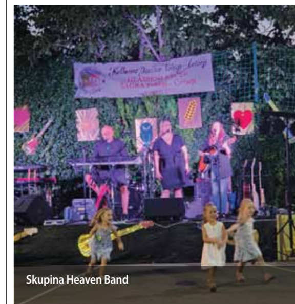
Skupina Heaven Band