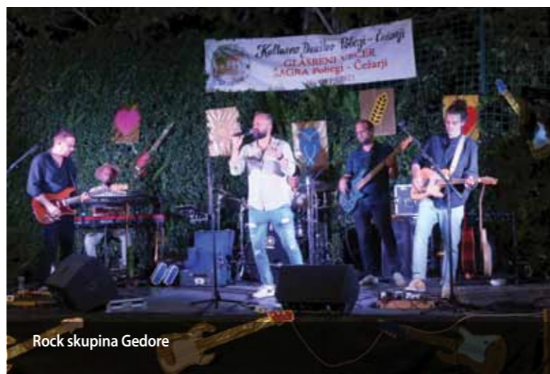
Rock skupina Gedore