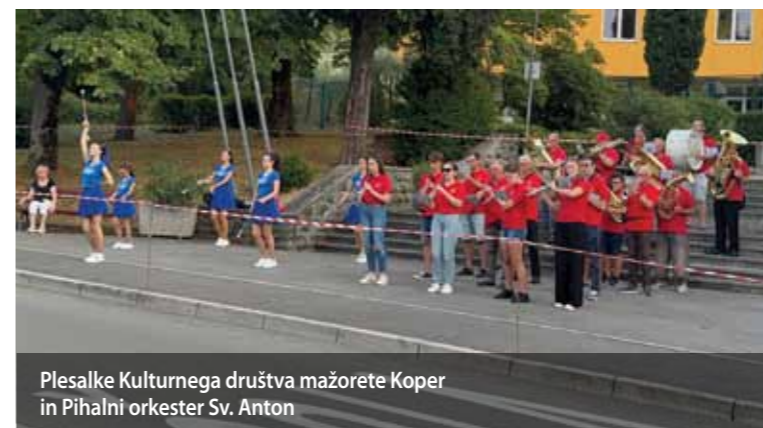
Plesalke Kulturnega društva mažorete Koper in Pihalni orkester Sv. Anton

Organizatorji so pripravili bogat, eno večerni program, ki je zajel različne glasbene zvrsti in združil številne domače ustvarjalce. Na odru so se predstavili: Pihalni orkester Sv. Anton , Kulturno društvo mažorete Koper , skupina Gedore , Heaven Band ter mlada rock zasedba Last Breath . Ob raznolikih melodijah se je plesišče hitro napolnilo, od otrok do starejših so se vsi z nasmehom prepustili glasbi in plesu.