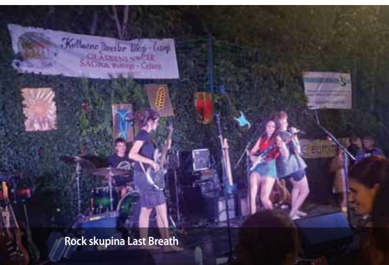
Rock skupina Last Breath