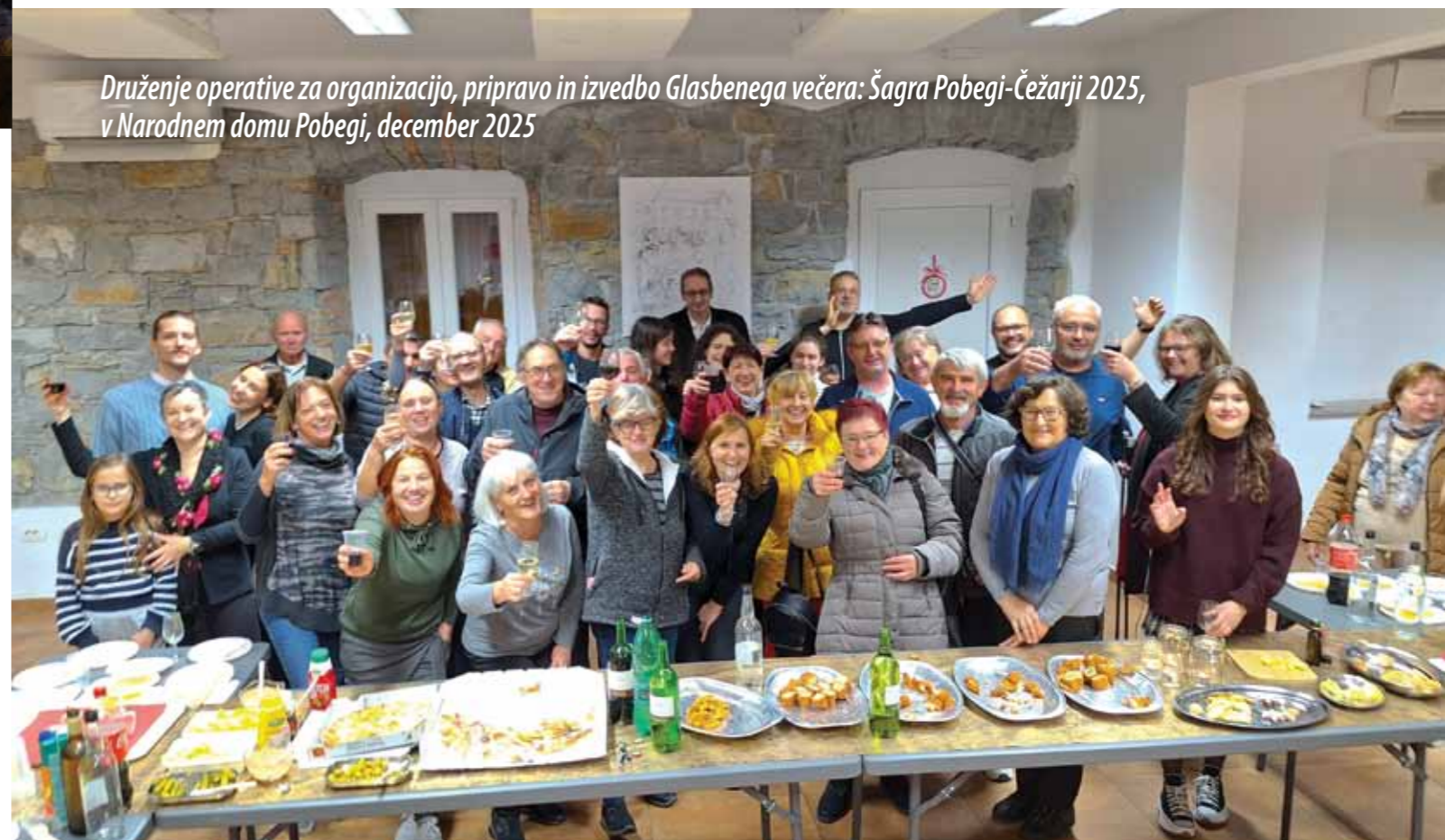
Druženje operative za organizacijo, pripravo in izvedbo Glasbenega večera: Šagra Pobegi-Čezarji 2025, v Narodnem domu Pobegi, december 2025