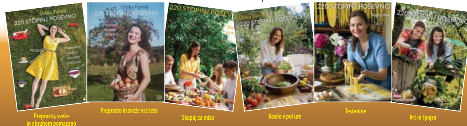
Preprosto, sveže in s kruhom pomazano

Vir: www.220stopinjposevno.com Fotografije in besedilo last avtorice Urške Fartelj avtorica soglašala z objavo vsebine